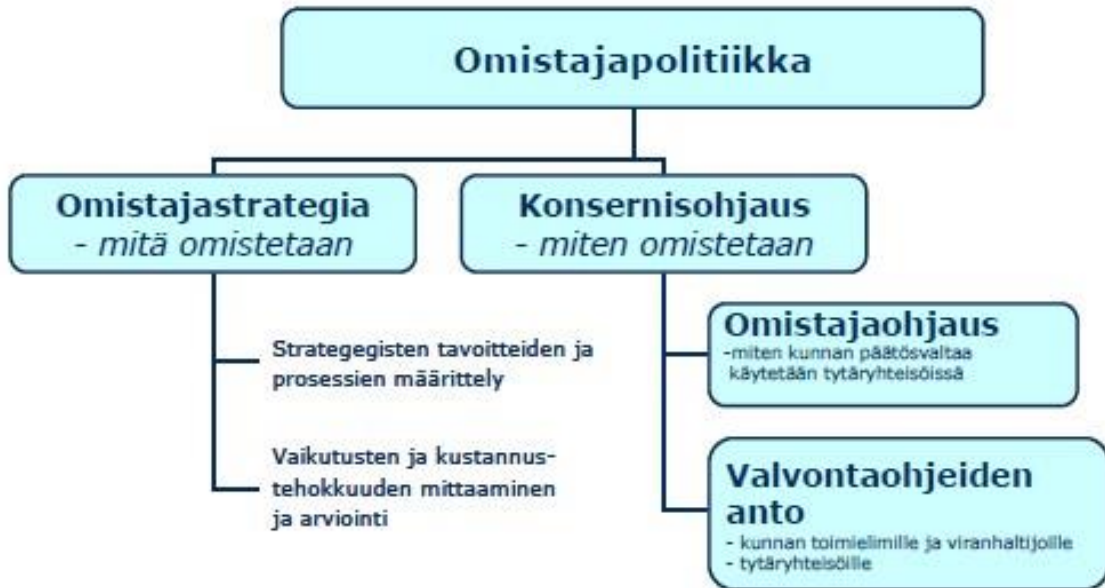
Kuva 1 Kuntayhtymän omistajapolitiikka ja konserniohjaus kuntien omistajapolitiikkaa soveltaen

Kainuun sosiaali- ja terveydenhuollon kuntayhtymän omistajaohjauksen keskeiset periaatteet ovat seuraavat: